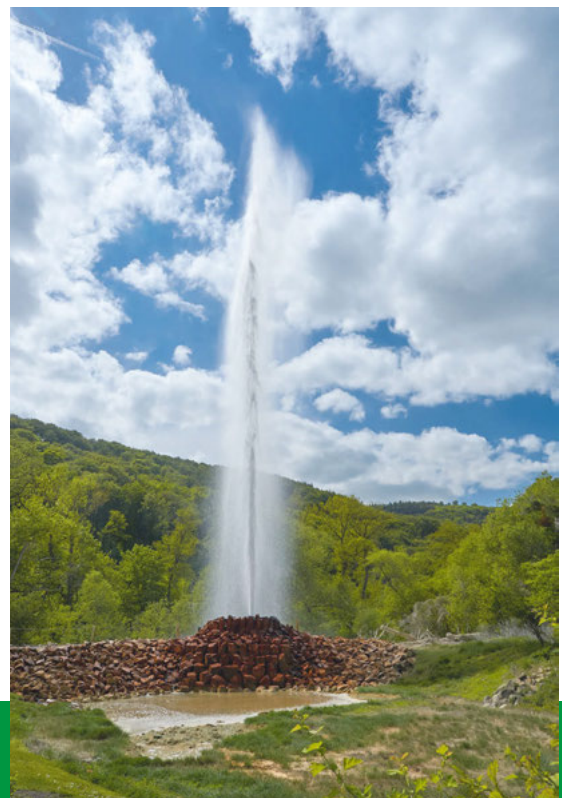
Geysir in Andernach

Grundwasserbrunnen können in geringere Tiefe gebohrt werden als Erdwärmesonden, der technische Aufwand ist entsprechend etwas geringer. Auch hier ist eine Genehmigung erforderlich, in diesem Fall von der Wasserbehörde. Generell ist der Bau von Grundwasserbrunnen stark reglementiert. Ihre durchschnittliche Jahresarbeitszahl ist jedoch innerhalb der drei Systeme die höchste.