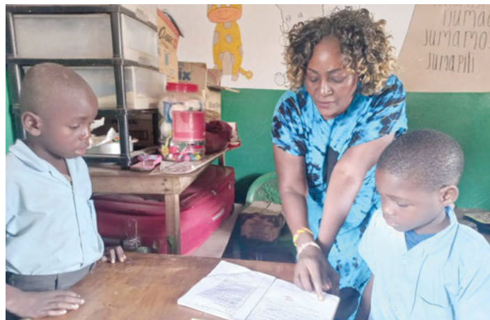
Lehrerin bespricht die Hausaufgaben mit den Schülern.