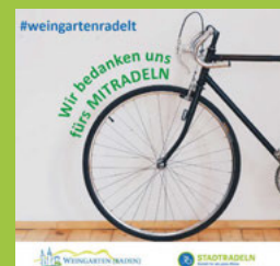
Stadtradeln 2023 erfolgreich abge- geschlossen Seite 5