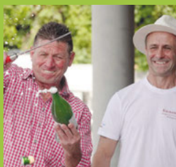
Erlebnistour in den Weinbergen Seite 3

Wir laden alle recht herzlich ein mit uns zu feiern.