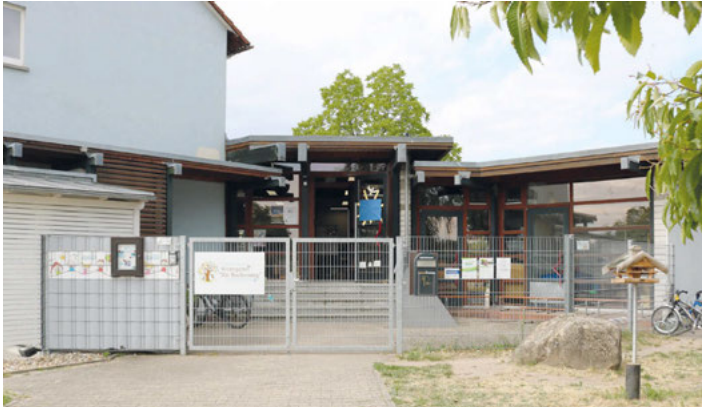
Kindergarten Am Buchenweg als Symbolbild

so müsse auf jeden Fall die Erschließung und Zufahrt optimiert werden. Die Ratsmitglieder stimmten einstimmig zu: Die Betreuungszeiten sollen angepasst werden. Eine weitere Gruppe im Naturkindergarten würde befürwortet. Für ein Tigere-Projekt sollen Räumlichkeiten gesucht werden. Die Machbarkeitsstudien sollen Aufschluss für die weiteren Maßnahmen geben.