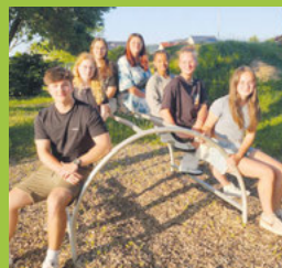
Ferienspaß in den Startlöchern Seite 4