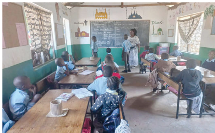
Das Elimu Kwa Wote Förderprogramm für Grundschüler unterstützt der Freundeskreis vorrangig.

Weitere Informationen: www.freundeskreis-dzarino.github.de Spendenkonto: DE38 6639 1200 0031 8868 05