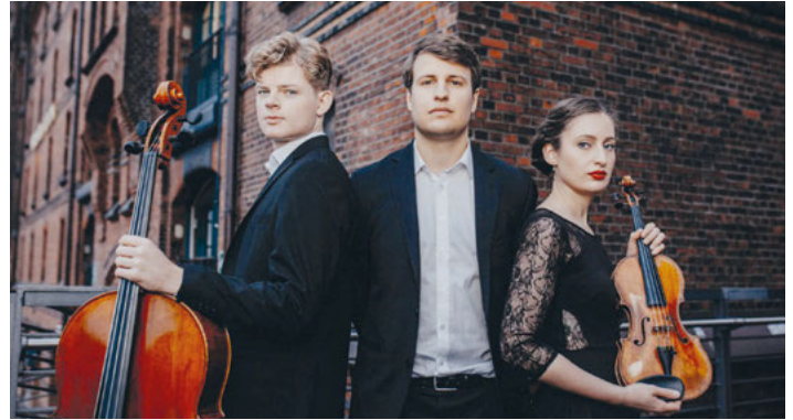
"SWR2 New Talent" Trio E.T.A.