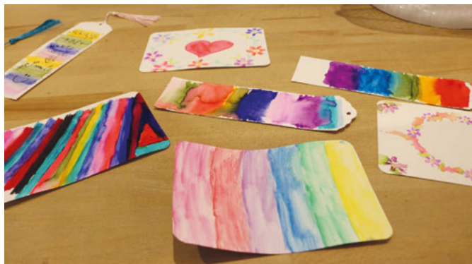
Die Lesezeichen und Postkarten müssen nur noch trocknen

Melanie Schaufler hat in ihrem Schreibwarengeschäft diese zauberhafte Beschäftigung als Ferienspaß angeboten. Aquarellpapier, wasserlösliche Tintenstifte, Holzstifte, Brush Pens, Fineliner und Wassertankpinsel standen auf dem langen Tisch im Ladengeschäft bereit und 15 Kinder saßen erwartungsvoll darum herum.