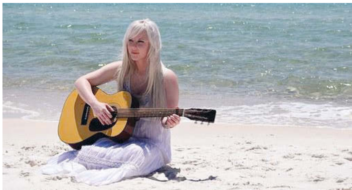
Auch in den Ferien...