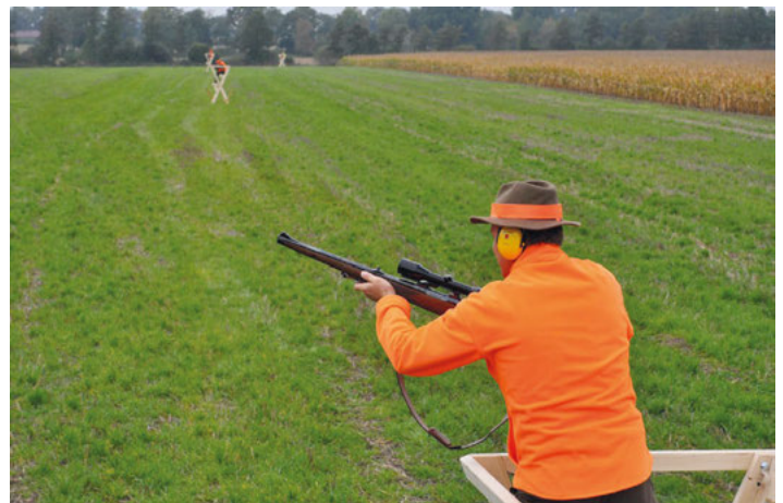
Ein wirksamer Kugelfang durch erhöhte Ansitzeinrichtungen und begrenzter Schussentfernung machen Erntejagden bedeutend sicherer

Weitere Hinweise und Empfehlungen finden sich in der SVLFG-Broschüre „Sichere Erntejagd“. Sie kann unter www.svlfg.de und mit dem Suchbegriff „B44“ kostenlos aus dem Internet heruntergeladen werden. Druckexemplare können telefonisch unter 0561 785-10339 oder online unter www.svlfg.de/broschueren-bestellen angefordert werden. Die Unfallverhütungsvorschrift Jagd findet sich unter dem Suchbegriff „VSG 4.4“.