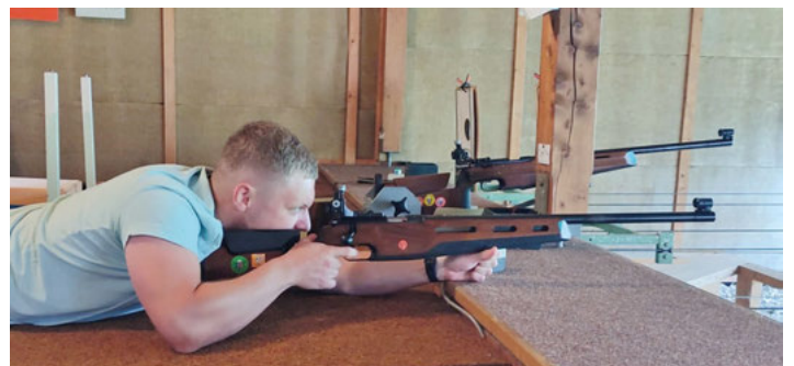
Mit geschickten Treffern konnte man beim Schinkenschießen viele Punkte sammeln.