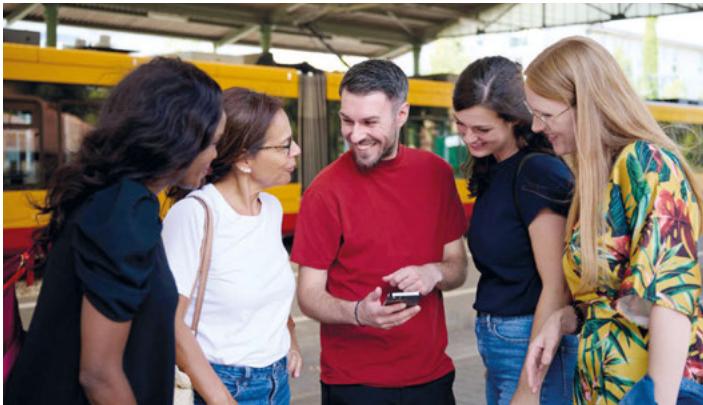
Ab September wird die Mitnahmefunktion bei der KVV.Luftlinie deutlich erweitert.