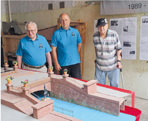
In der Sonderausstellung „200 Jahre Marktbrücke“ ist auch das Modell der Tulla-Brücke zu sehen, das der Verein beim Festzug der Tausend-Jahr-Feier präsentierte.

Zugleich veranstaltet der Akkordeon-Spielring am Tag des offenen Denkmals auch sein traditionelles Sommerfest ab 11 Uhr erstmals im Heimatmuseum und sorgt mit harmonischen Klängen und guter Bewirtung für das Wohl der Gäste. -rof-