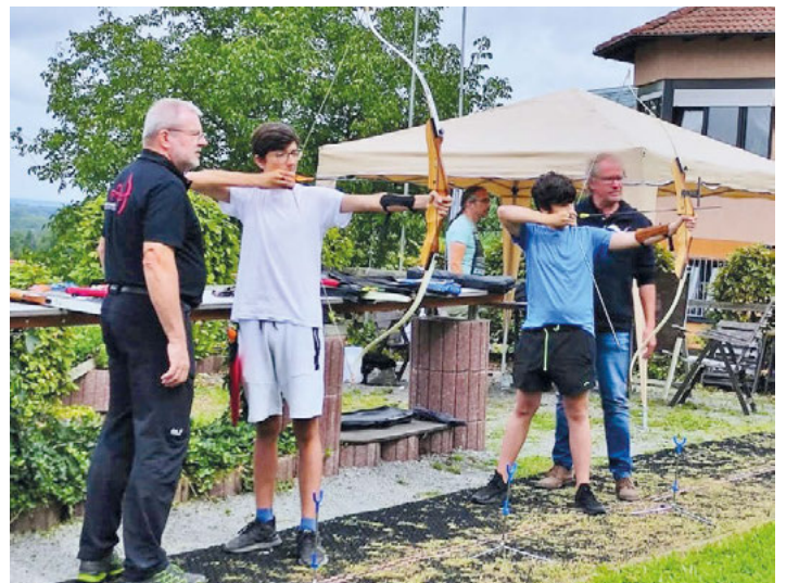
Erfahrene Schießleiter gaben Hilfestellung beim Bogenschießen.

Für die Teilnahme und Begeisterung an unserem Schießsport sagen wir vielen herzlichen Dank und wenn es euch gefallen hat, kommt doch mal zu einem Schnupperschießen vorbei. Wir würden uns jedenfalls sehr freuen.