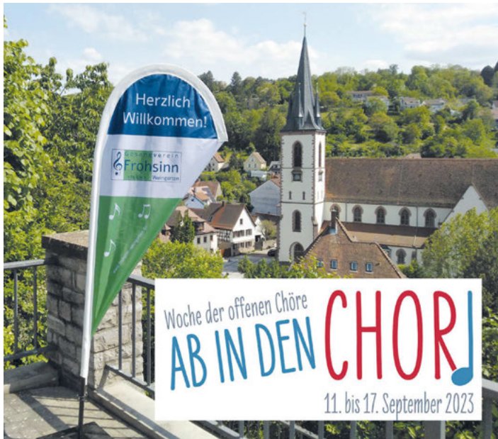
Komm und sing mit - Woche der offenen Chöre, wir sind dabei am 14.09.2023!

Nicht nur am 14. September, sondern bei jeder unserer Chorproben sind Interessierte herzlich eingeladen, reinzuschnuppern und mitzusingen. Komm und sei dabei! Weitere Informationen auch auf www.frohsinn-weingarten.de