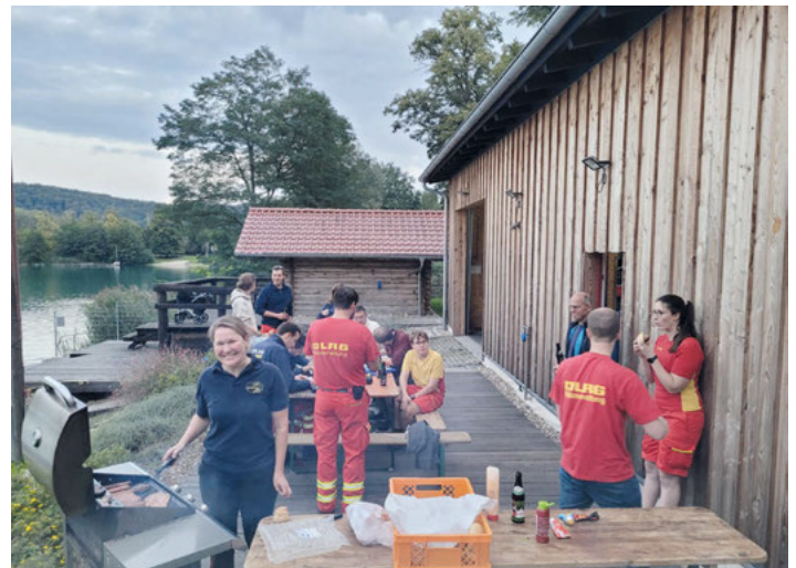
Abschlussgrillen der Einsatztaucher

Trotz schlechter Sicht unter Wasser hatten alle Spaß beim anschließenden Grillen. Vielen Dank an Grillmeisterin Steffi!