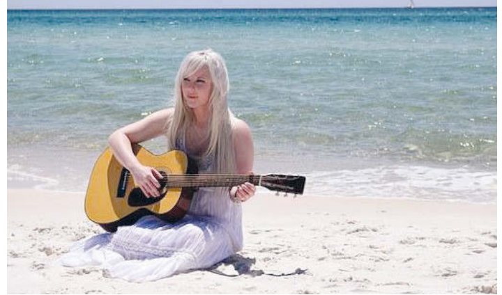
Auch im Urlaub...

Bei Fragen rund um die Musikschule sind wir für Euch da: Tel. 07249/1859 oder sekretariat@musikschule-hardt.de . Euer Team der Musikschule Hardt