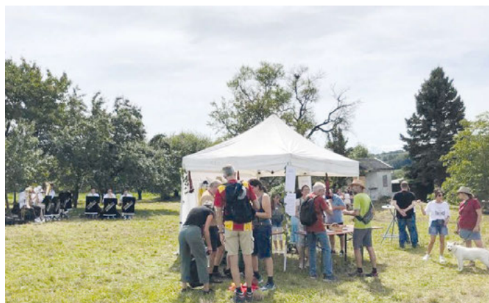
"Brasspedal" unterhält am Weinstand im Löwental