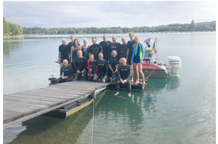
Die Teilnehmer vor dem Start