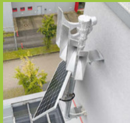
Bundesweiter Warntag am 14.09. Seite 6-7