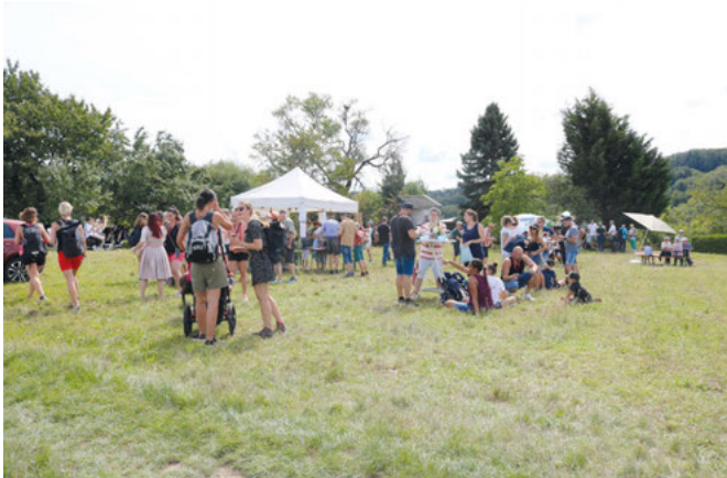
Probierstand im Löwental

Im Weitergehen zeigte er ein Feld mit Dunkelfelder Trauben und kam auf Färbertrauben zu sprechen, auf Maischegärung beim Rotwein. Früher sei ein tiefdunkler Rotwein nicht so einfach gewesen, seit dem Klimawandel sei das anders. Es seien auch ganz andere Trauben Sorten zu finden, so in einem Rebenstück mit „International Rot“, beispielsweise Merlot und vor allem die PiWi-Sorten (pilzwiderstandsfähig), was aber auch den Einsatz von Pflanzenschutz reduzieren könne.