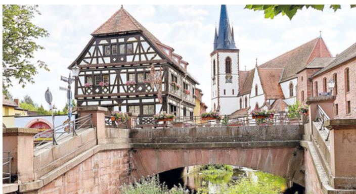
Ortskern mit Tullabrücke