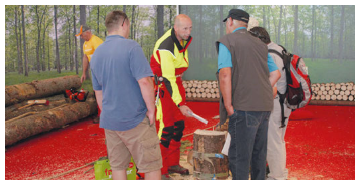
Auf Messen führen die SVLFG-Präventionsfachleute Arbeitsmethoden vor, die das Unfallrisiko bei der Waldarbeit senken.

Die SVLFG-Broschüren „B47 – Baumbeurteilung“ und „B50 – sicherer Fällungsablauf“ können über www.svlfg.de/b47 sowie www.svlfg.de/b50 heruntergeladen werden. Druckexemplare können kostenfrei über www.svlfg.de/broschueren-bestellen angefordert werden. Weitere Informationen zur sicheren Waldarbeit, zum Beispiel Fachbeiträge, Muster-Gefährdungsbeurteilungen, Lehrfilme und die App „Stockfibel to go“ sowie eine Liste der anerkannten Fortbildungsstätten für Motorsägenkurse finden sich unter www.svlfg.de/forst . Für Versicherte lohnen sich Fortbildungsmaßnahmen besonders, weil die SVLFG Zuschüsse für die Teilnahme an zwei- bis fünftägigen Lehrgängen gewährt. Voraussetzung: Die Fortbildungsstätte muss von der SVLFG anerkannt sein. Die Höhe der Zuschüsse variiert. Die Teilnehmenden erhalten für einen zweitägigen Kurs 60 Euro, für einen dreitägigen Kurs 75 Euro und für einen fünftägigen Kurs 105 Euro. Teilnehmende geben bei der Anmeldung in der Fortbildungsstätte ihre SVLFG-Mitgliedsnummer an. Nach Abschluss des Lehrganges erhalten sie von dort einen Gutschein, der ausgefüllt und per Mail an praevention@svlfg.de geschickt wird.