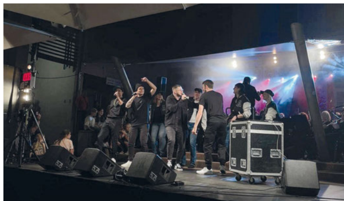
Die Weingartner Fantastischen Vier mit "Zusammen", der Siegertitel der Hitparade 2023

Alle Informationen über den Musikverein, die Orchester und Veranstaltungen findet ihr immer aktuell unter www.musikverein-weingarten.de .