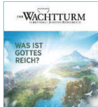
Aktionsausgabe "Was ist Gottes Reich?"

Nähere Informationen bietet auch die örtliche Gemeinde in Weingarten und die website www.jw.org .