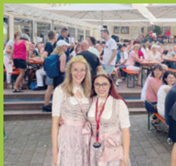
Das Wochenende mit Musik & Wein Seite 3-5

Wir wünschen allen einen erfolgreichen Start in die Woche.