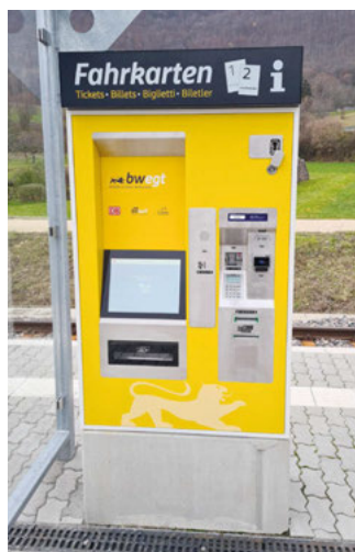
Neue Optik, verbesserte Funktionalität: So sieht die neue Generation der Fahrscheinautomaten aus.

Mit dem Rollout der neuen Automaten setzt die AVG eine Vorgabe des Landes Baden-Württemberg im neuen AVG-Verkehrsvertrag für das Netz 7a um. Als Aufgabenträger für den Schienenpersonennahverkehr möchte das Land den Fahrgästen auf möglichst allen ÖPNV-Eisenbahnstrecken im Land einheitlich aussehenden Fahrkartensystemen mit vergleichbarem Funktionsumfang anbieten. Im Netz 7a betrifft dies die Strecken der AVG-Linien S31/S32, S4, S5 (nur Streckenabschnitte in Baden-Württemberg), S6, S7/S71 und S8/S81.