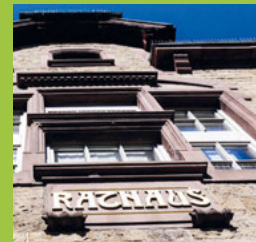
Aus dem Ausschuss für Umwelt und Technik Seite 8-9