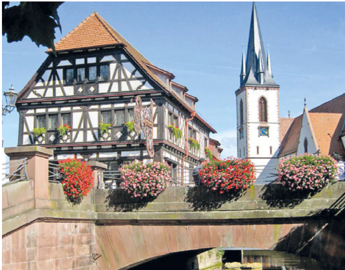
Das Jubiläum „200 Jahre Marktbrücke – 1823 bis 2023“ steht im Mittelpunkt der Sonderausstellung im Heimatmuseum am „Tag des offenen Denkmals“ am Sonntag.

Zugleich veranstaltet der Akkordeon-Spielring am Tag des offenen Denkmals auch sein traditionelles Sommerfest ab 11 Uhr erstmals im Heimatmuseum und sorgt mit harmonischen Klängen und guter Bewirtung im Hof und im Künstlerzimmer für das leibliche Wohl der Gäste. -rof-