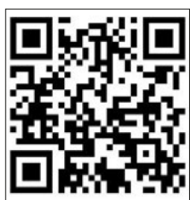
QR-Code unserer Homepage

Bürger- und Heimatverein Weingarten e.V. www.bhv-weingarten.de