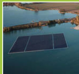
Gemeinderats- exkursion „Photo- voltaikanlage“ Seite 4-5