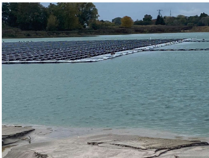
Photovoltaikanlage Baggersee Leimersheim

Für alle Beteiligten war der Ausflug nach Leimersheim in jeder Hinsicht sehr informativ.