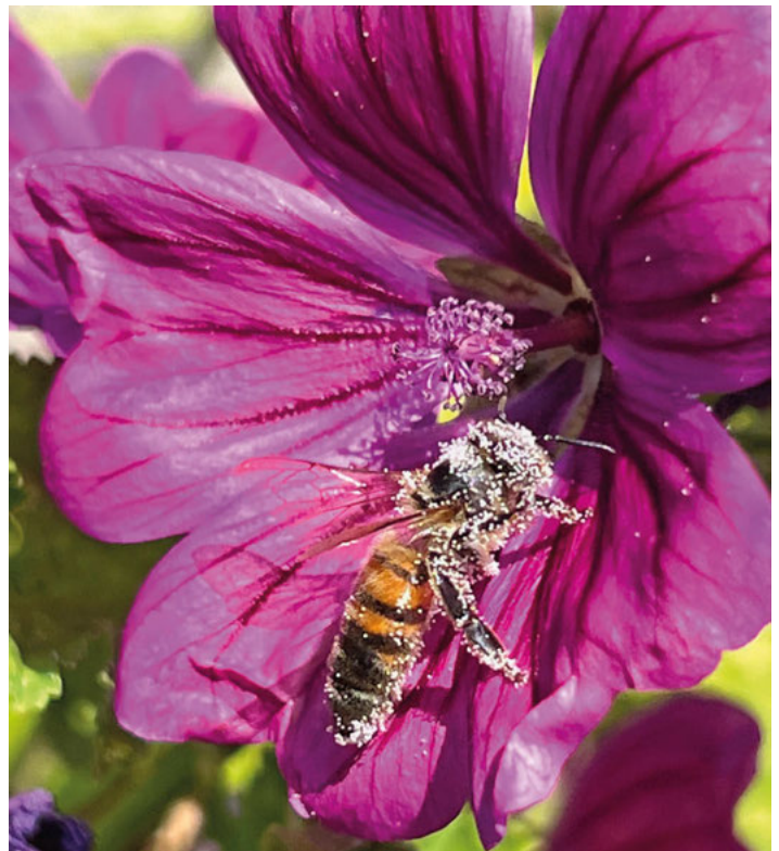
Hier wird jeder satt. Für die Biodiversität werden Wildblumen am Acker angepflanzt.