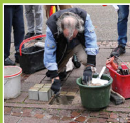
Weitere Stolper- steine verlegt Seite 3-4