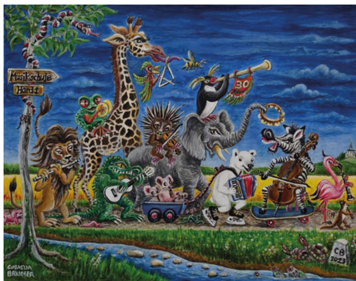
Der Jubiläumsmarsch rollt ....

Am 18. November d.J. findet unser Abschlusskonzert zum 30-jährigen Jubiläum unserer Musikschule Hardt statt. An diesem Abend werden Lehrer und Lehrerinnen unserer Schule ein buntes Programm unterschiedlicher Stile spielen.