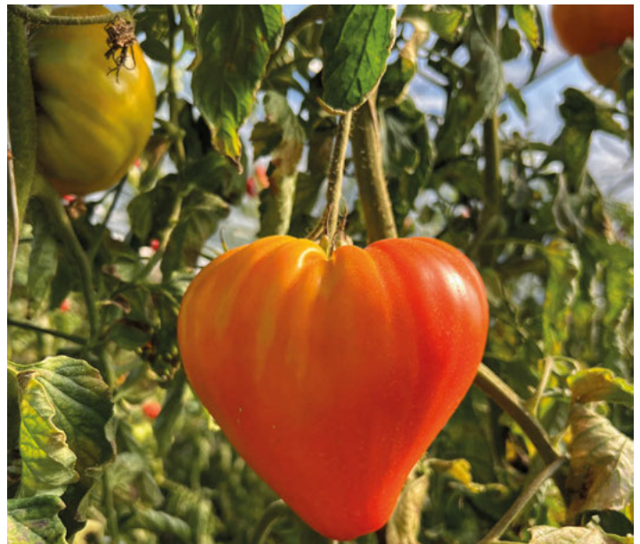
Du siehst und schmeckst den Unterschied.

Die nächste Biiterrunde findet am 25. November um 15 Uhr in der Aula der Turmbergschule in Weingarten statt. Offene Fragen werden gerne zuvor am Infoabend für alle Interessierte beantwortet. Mehr Infos dazu gibt's unter gutesgemuese.de .