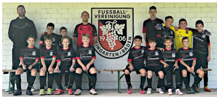
Unsere D2 in den neuen Trikots

Am 21. Oktober stand für unsere D2-Jugend das letzte Heimspiel der Vorrunde im heimischen Waldstadion auf dem Plan. Im Rahmen des Spiels wurde unseren D2-Junioren ein neuer Trikotsatz – gesponsert von der Firma Consulting4IT – übergeben.