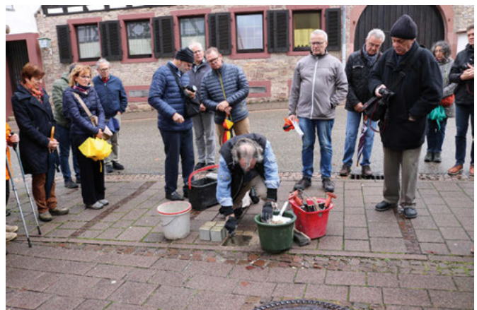
Der Künstler Günther Demnig verlegt Stolpersteine im Straßenpflaster vor Häusern, in denen jüdische Mitbürger gewohnt haben

Die Gemeinde Weingarten will sich an dem Mahnmalprojekt der Gemeinde Neckarzimmern beteiligen. Dort wurde ein steinernes Denkmal in Form eines liegenden Davidsterns errichtet, auf dessen Zacken Erinnerungssteine der insgesamt 137 badischen Deportationsgemeinden aufgestellt werden. Jeweils ein zweiter gleich aussehender Stein wird in der jeweiligen Gemeinde aufgestellt.