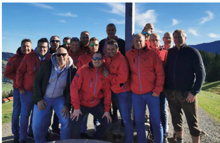
Unsere AH am Gipfel...

Unsere Alte-Herren-Abteilung bestritt am Wochenende vom 27. bis 29. Oktober wieder ihren jährlichen Mannschaftsausflug. Dieses Jahr ging es - wie bereits im Jahr 2019 - nach Oberstaufen im Allgäu. Bei tollem Wetter wurde gewandert, gefeiert, gelacht und dabei das Mannschaftsgefüge gefestigt. Die mitgereisten 17 Sportskameraden hatten sehr viel Spaß, es war ein rundum gelungener Ausflug.