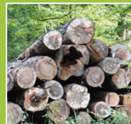
Start Holzverkauf Seite 5