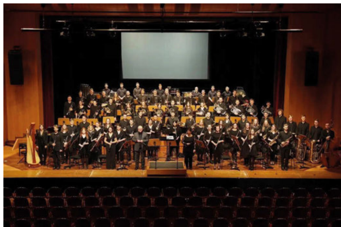
Das Sinfonische Jugendblasorchester Karlsruhe (SJBO)

Voraussetzung für die Aufnahme in das Orchester ist ein beständiges Vorspiel. Neue Mitglieder wachsen bei den alle vier Wochen stattfindenden Proben in ihre Register hinein und können sich an älteren Registerkollegen orientieren. Jede Probe dient merklich der Weiterentwicklung – vom tiefen Blech übers Schlagzeug bis zum hohen Holz.