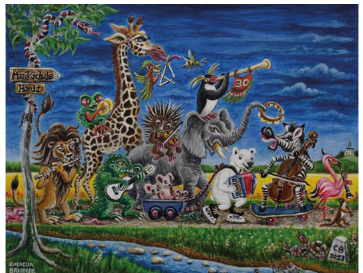
Der Jubiläumszug rollt ....