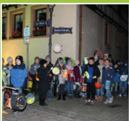
Martinsfest der Turmbergschule Seite 3-4