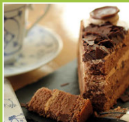
Einladung zum Senioren- nachmittag Seite 5