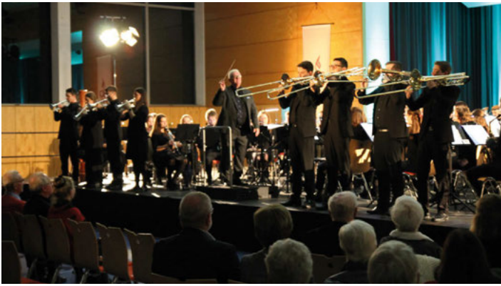
Das SJBO begeistert bei Galakonzert in der Walzbachhalle