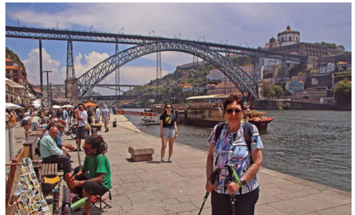
Die berühmte Brücke in Porto über den Douro

Dies alles bietet Portugal, das wir Ihnen in bunten Bildern zeigen. Ist Ihr Interesse geweckt, dann kommen Sie zu unsrem Vortrag am Sonntag, 19.11.2023 um 15:00 Uhr ins katholische Gemeindezentrum, Schillerstraße 4.