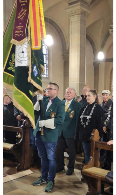
Einmarsch der Weingartner Delegation in die St. Barbara Kirche in Forst.