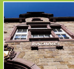
Einladungen zu Gemeinderats- sitzungen Seite 6