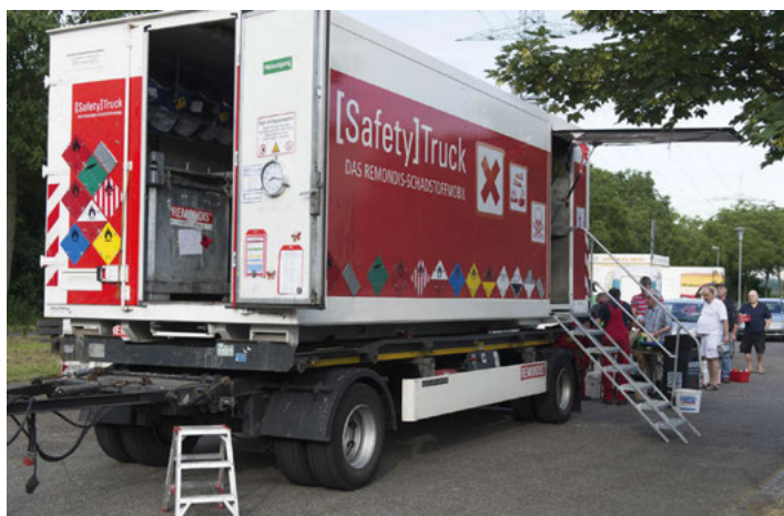
Bei der mobilen Schadstoffsammlung können alle privaten Haushalte und Kleingewerbebetriebe umweltschädliche Abfälle abgeben.

Alle Fragen zur mobilen Schadstoffsammlung werden über das Servicetelefon des Abfallwirtschaftsbetriebes unter der gebührenfreien Rufnummer 0800 2 98 20 20 beantwortet.