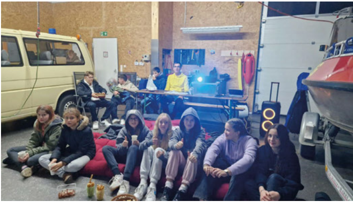
Entspannte Erwartung auf den Film