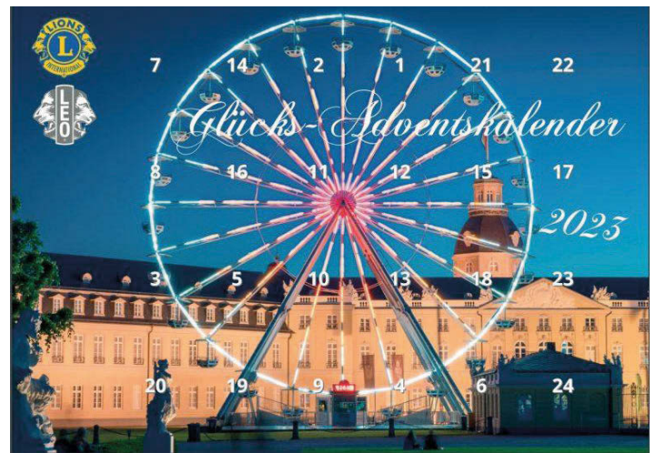
Glücks-Adventskalender des Lions Club Karlsruhe