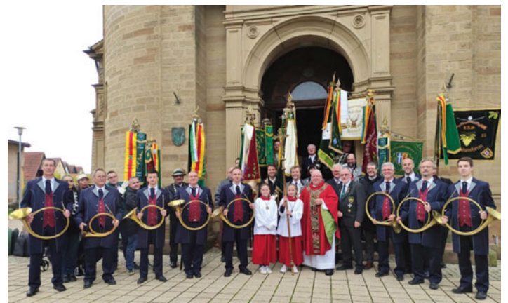
Eindrucksvolle Hubertusmesse in Forst mit den Jagdhornbläsern aus Schriesheim.