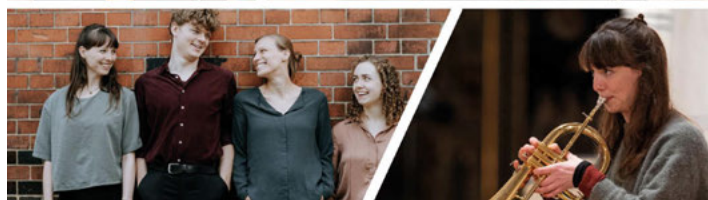
Nilius Pfunda Kollektiv