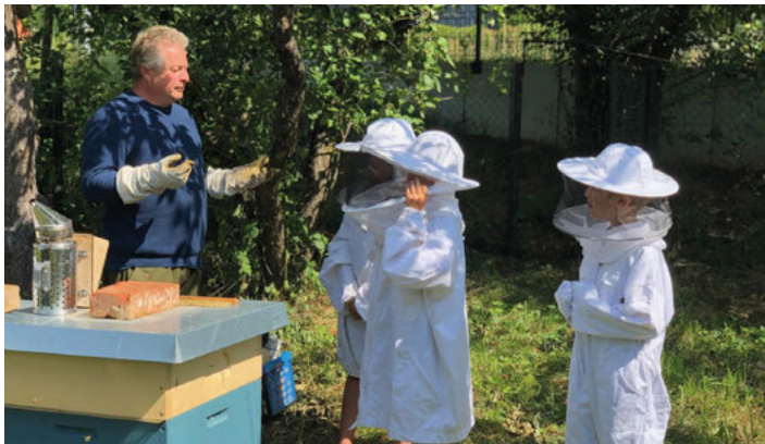
Ferienpaß am Acker: praktisch handeln und hautnah erfahren.

Am 25.11. findet die Bieterrunde statt. DER Termin, zum Einsteigen, mitmachen und Gemüse genießen. HEUTE findet außerdem der Infoabend statt. Online oder vor Ort in der Aula der Turmbergschule. Mehr Infos unter gutesgemuese.de .