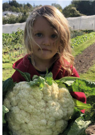
Mit großer Freude ernten und essen auch schon die Kleinsten das gute Gemüse.

Unser landwirtschaftlicher Betrieb hat sich darüber hinaus als kreative Plattform etabliert, auf der Kunst und Umweltbewusstsein Hand in Hand gehen. In Zusammenarbeit mit verschiedenen Künstlern, darunter einem Projekt, das sich auf die Verwendung von Würmern zur Erzeugung fruchtbarer Erde konzentrierte, pflegen wir eine nachhaltige und erdverbundene Kunstkultur. Aktuell freuen wir uns über eine Kooperation mit dem Badischen Kunstverein in Karlsruhe.