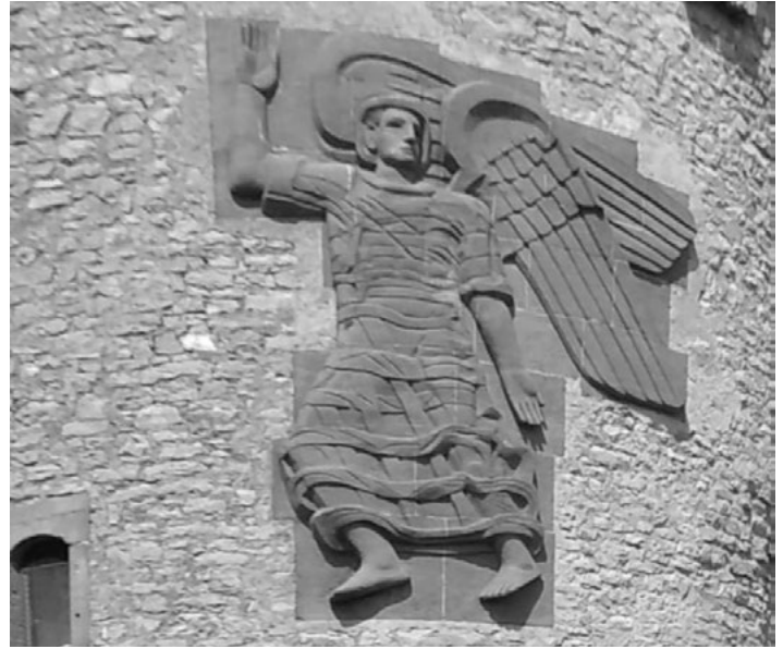
Friedensengel am Weingartner Wartturm

Folgt uns auf Instagram @Frohsinn-Weingarten und auf facebook Frohsinn Weingarten